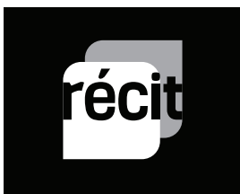
Version en noir et blanc inversé