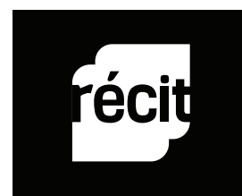
Version monochrome inversé